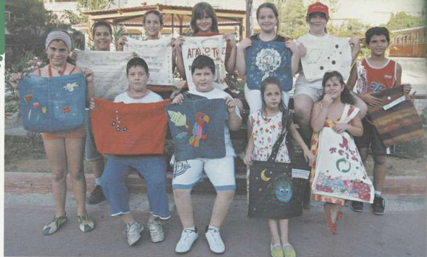
Τα παιδιά με τις δημιουργίες τους

• 4ο Δημοτικό Σχολείο Αγ. Παρασκευής Αττικής • ΚΔΑΠ Κοινότητας Αντικύρων Βοιωτίας • 1ο Δημοτικό Σχολείο Αρκαδοχωρίου Ηρακλείου Κρήτης • 14ο Δημοτικό Σχολείο Αθηνών Αττικής • 1ο Νηπιαγωγείο Παροικιάς Πάρου Κυκλάδων • Ελληνογαλλική Σχολή Ουρσουλίνων Αττικής • 21ο Δημοτικό Σχολείο Κερατσινίου Αττικής • 13ο Δημοτικό Σχολείο Κερατσινίου Αττικής • Γυμνάσιο Αμπελώνα Λάρισας • 123ο Νηπιαγωγείο Αθηνών Αττικής • Δημοτικό Σχολείο Αγ. Κωνσταντίνου Φθιώτιδας • Δημοτικό Σχολείο Ανατολής Νέας Μάκρης Αττικής • 1ο Δημοτικό Σχολείο Ποθύγυρου Χαλκιδικής • Δημοτικό Σχολείο Άργους Καλύμνου Δωδεκανήσων • 6ο Δημοτικό Σχολείο Κατερίνης Πιερίας, Νηπιαγωγείο Θολοποταμίου Ν. Ιωνίας Χίου • 15ο Δημοτικό Σχολείο Μυτιλήνης • Νηπιαγωγείο Παραλίας Πιερίας, Δημοτικό Σχολείο Βροντούς Σαλαμίνας • Ειδικό Δημοτικό Σχολείο Περατάνων Λειβαθούς Κεφαλονιάς • 2ο Γυμνάσιο Καθαμάτας Μεσσηνίας