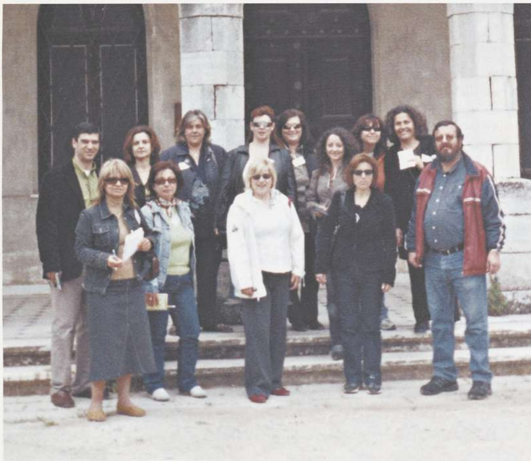
Στο Μέγαρο Δούκισσας Πλακεντίας

βαλθοντικό μονοπάτι στην περιοχή της Πεντέλης.