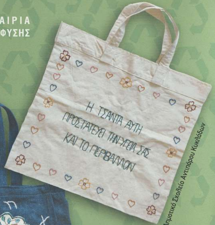
Δημοτικό Σχολείο Αντιπάρου Κυκλάδων