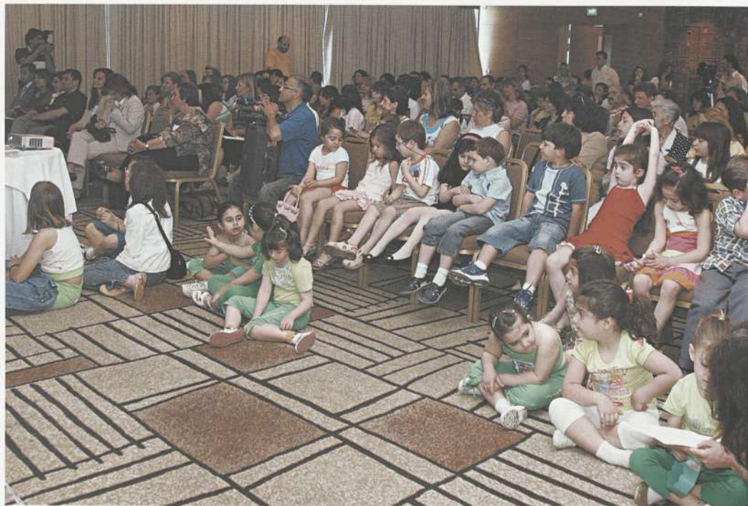
Η αίθουσα Galaxy του Athens Hilton γέμισε μαθητές

Όταν ξεκίνησε το 1996, το Πρόγραμμα «Φύση Χωρίς Σκουπίδια» της Ελληνικής Εταιρίας Προστασίας της Φύσης (ΕΕΠΦ), η λέξη σκουπίδι προκαλούσε απλά δυσφορία. Πολλές φορές ακούσαμε τη φράση «με τα σκουπίδια θα ασχολούμαστε τώρα;». Σήμερα, η σωστή διαχείριση των απορριμμάτων έχει γίνει πρώτη ανάγκη.