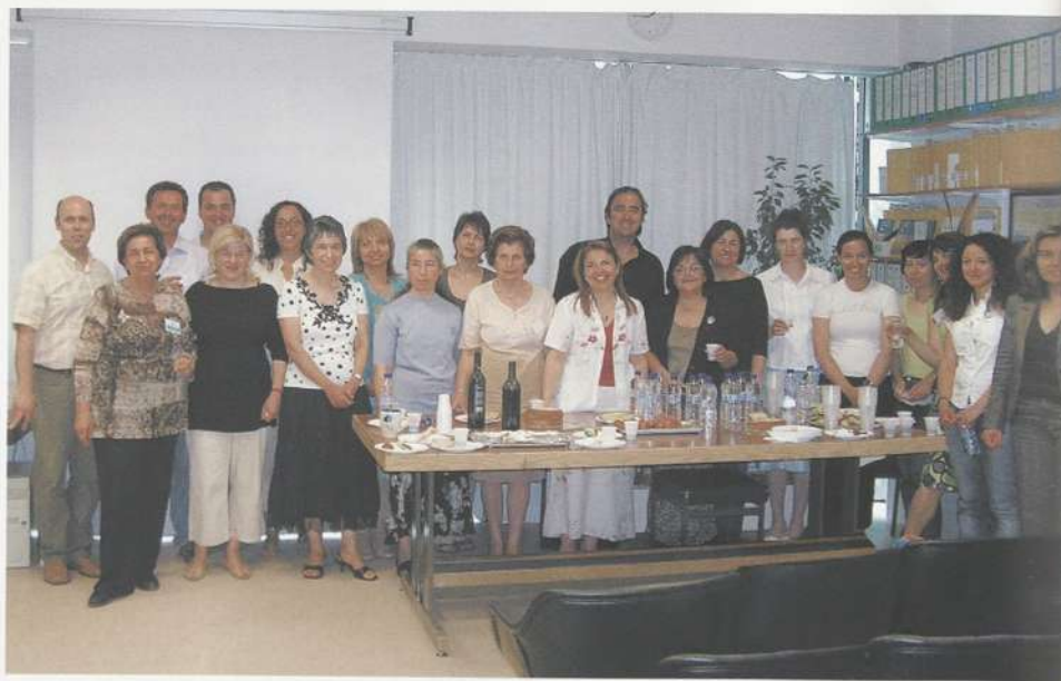
Η εκδήλωση στα γραφεία της ΕΕΠΦ.

Υπεύθυνη Περιβαλλοντικής Εκπαίδευσης της Β' Δ/σης Αθίνας.