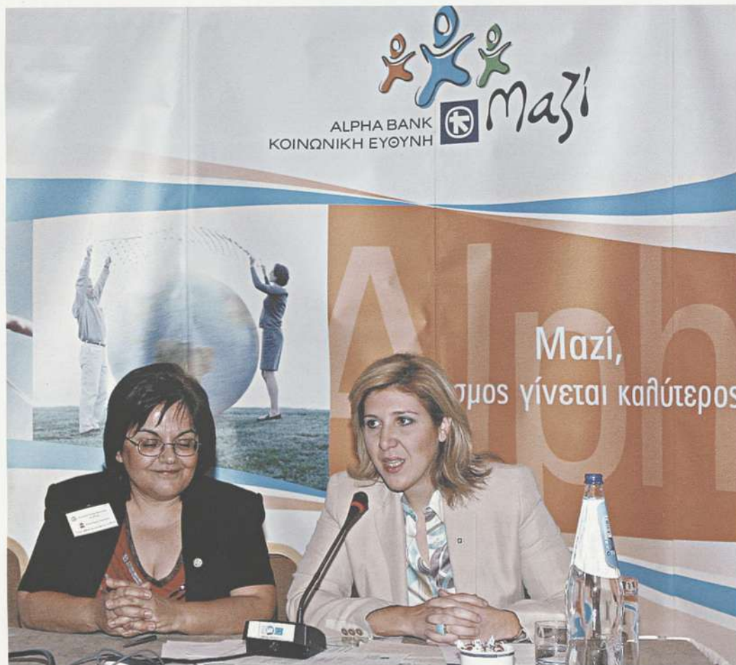
ΕΕΦΦ και ALPHA BANK καθισωρίζουν

Χαλανδρίου Αττικής • 9ο Δημοτικό Κερατσινίου Αττικής • 1ο ΤΕΕ Άργους Αργολίδας • Η εθελοντική ομάδα του Ι.Ι.Ε.Κ. Hotelia της PAP HOTELS CORP Θεσσαλονίκης • 24ο Νηπιαγωγείο Αιγάλεω Αττικής • 10ο Νηπιαγωγείο Πατρών Αχαΐας • Δημοτικό Αμυγδαλέων Γρεβενών • Δημοτικό Κάμπου Λακωνίας • Αναξαγόρειο Γυμνάσιο Ν. Λαμφάκου Εύβοιας • 2ο Γυμνάσιο Κομοτηνής Ροδόπης – Γυμνάσιο & Λύκειο Επισκοπής Ρεθύμνου • Γυμνάσιο Πλατανιάς Κιλίκης • Δημοτικό Παγώνδα Σάμου Δωδεκανήσων • 4ο Γυμνάσιο Ρεθύμνου • 1ο Δημοτικό Νάξου Κυκλάδων • Δημοτικό Αργυρούπολης Ρεθύμνου • 4ο Δημοτικό Μυτιλήνης Λέσβου • Γυμνάσιο Σπηλίου Ρεθύμνου • 2ο Γυμνάσιο Κιλίκης • 29ο Δημοτικό Σχολείο Αθηνών Αττικής • Γυμνάσιο Κιβωτού Γρεβενών • Σχολή Χατζήβη Αττικής • 13ο Δημοτικό Κερατσινίου Αττικής • 5ο Νηπιαγωγείο Κερατσινίου Αττικής.